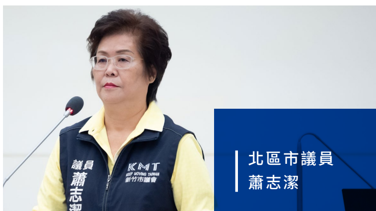
北區市議員 蕭志潔