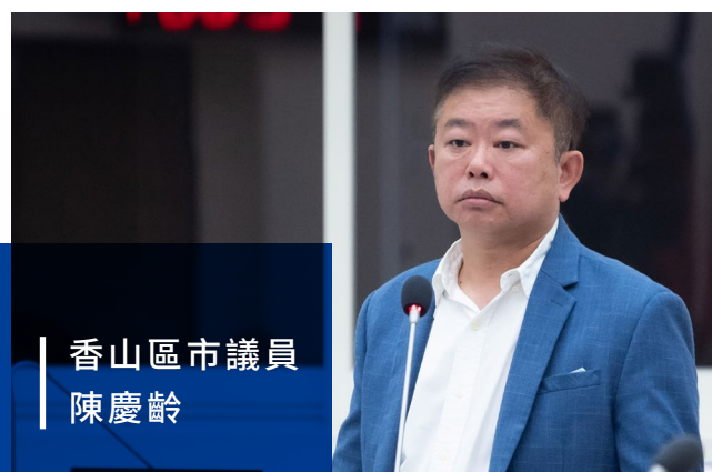
香山區市議員 陳慶齡